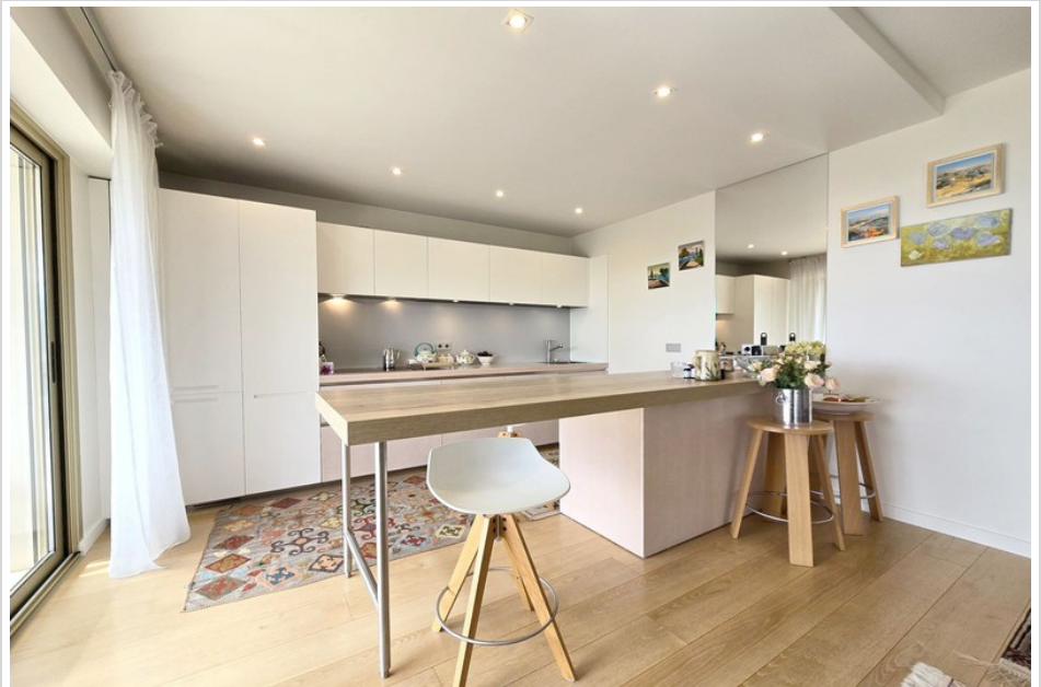
Apartment 2495 Le Cannet